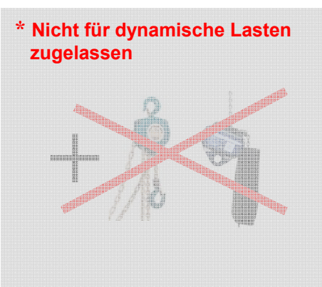
Kurzgliedrige Ketten (DIN EN 818-4)